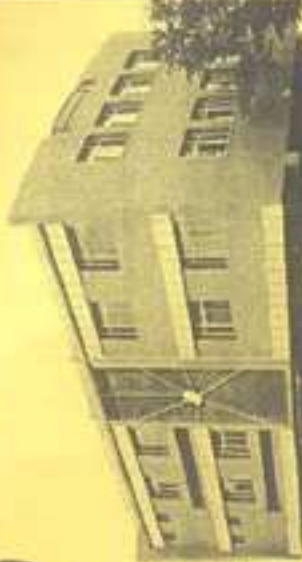
KINDERGARTEN, 1/5/5 Arundelpeis