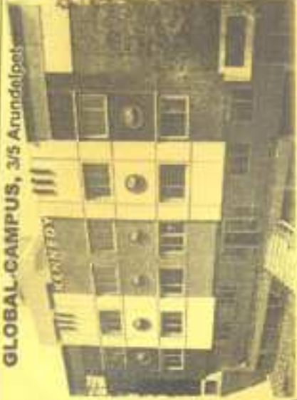
GLOBAL CAMPUS, 3/5 Arundelpeis